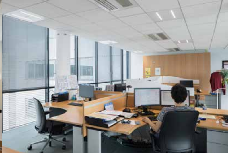
Eclairage des bureaux après rénovation

D'une surface de 26.000 m 2 , le siège social de SAIPEM en France reçoit ses 2.000 salariés dans un immeuble R+6 divisé en 4 zones (A, B, C, D). Il est constitué d'un rez-de-chaussée où se trouve l'espace d'accueil et de 6 étages identiques où sont réunis les plateaux de bureaux, les salles de réunion et deux zones de confort. Construit en 2001, le bâtiment aux larges façades vitrées disposait, entre autres, d'un éclairage indirect par dalle équipée de deux tubes fluocompacts d'une puissance de 55W chacun, allumé en permanence de 6h00 à 21h00. Celui-ci devenu obsolète, l'entreprise décide fin 2021 de procéder à son remplacement afin de répondre aux objectifs de réduction de consommations énergétiques fixés par la loi ELAN.