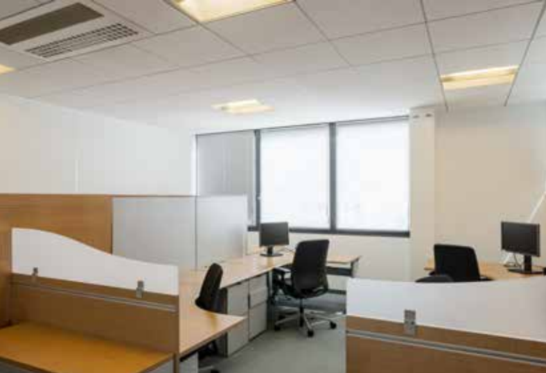
Eclairage des bureaux avant rénovation